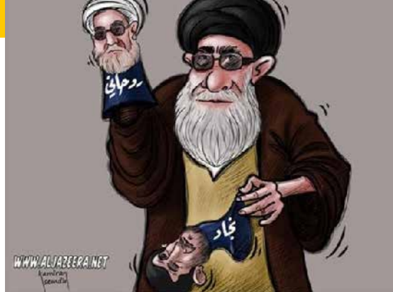
Presidentswissel Iranian style

naar andere landen, waar ze (sjiitische) groepen trainen en bewapenen. Hoge officieren van de Garde controleren maar liefst een derde van de Iraanse economie. Zij hebben belangen in ondernemingen en complete bedrijfstakken, waardoor regeringsbesluiten over het landsbestuur en de economie van Iran hen direct raken.