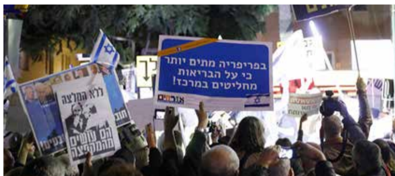
Duizenden Israeli's eisten vorige maand in Tel Aviv het aftreden van Benjamin Netanyahu.

In 2008 was toenmalig premier Ehud Olmert (Kadima) aan de beurt. In tegenstelling tot Netanyahu legde hij tijdens het politieonderzoek zijn functie neer. Een jaar later werd beslist om Olmert te berechten. Hij werd schuldig bevonden, zat bijna anderhalf jaar in de gevangenis en kwam in juli vorig jaar vrij. Andere beschuldigingen tegen politici, waaronder enkele bewindslieden, hebben niet geleid tot hun