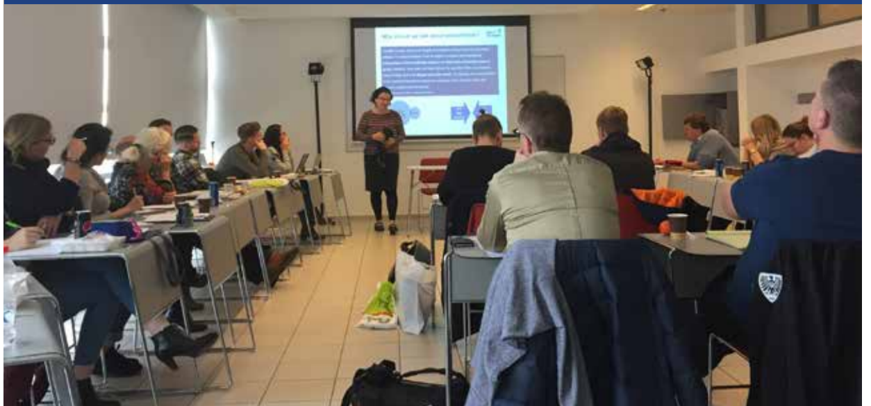
Nederlandse docenten in Yad Vashem, januari 2018.

De 'Poolse kwestie' bewijst nog eens hoe belangrijk Holocausteducatie is. Op 29 december 2016 vertrok CIDI met een groep van 26 docenten naar Israël. Deze groep docenten nam deel aan het jaarlijks tien-daags seminar in Yad Vashem over 'hoe les te geven over de Holocaust in een veranderende Nederlandse samenleving'. Tijdens het seminar kregen docenten colleges, workshops en leerden zij nieuwe lesmethoden. Het educatief concept van Yad Vashem werd hen duidelijk gemaakt en de docenten raakten geïnspireerd in het ontwikkelen van