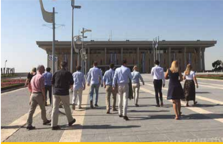
Journalisten op weg naar de Knesset.

Gedurende de reis spraken de journalisten en beleidsmakers met Israëlische en Palestijnse politici, met experts op deelgebieden, academici en de gewone mensen op straat. De reis was een groot succes en in de media verschenen diverse artikelen. Een van de journalisten schreef zelfs 17 artikelen over de reis. Aan de studiereis gingen twee voorbereidende bijeenkomsten vooraf waarin de deelnemers colleges kregen over de geschiedenis van het Arabisch-Israëliësch conflict.