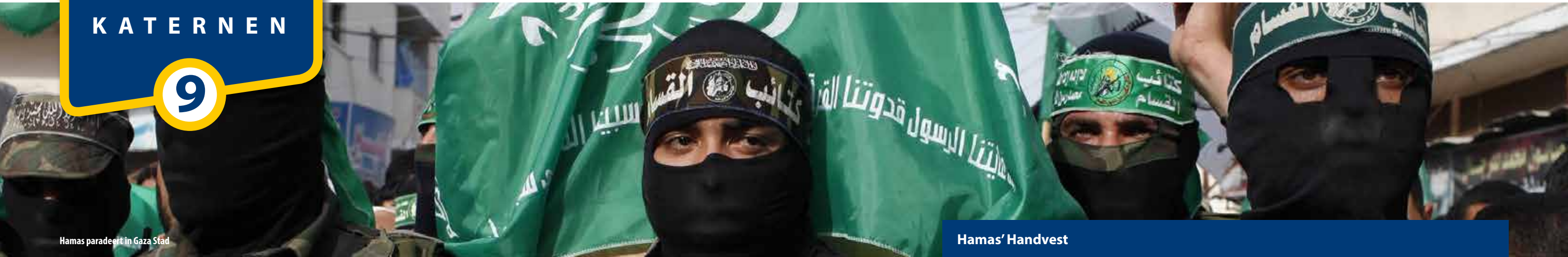
Hamas paradeert in Gaza Stad

'Hamas', 'moed' in het Arabisch, is het acroniem van Harakat al-Muqawama al-Islamiyya (Islamitische Verzetsbeweging) en heeft als verklaard doel de staat Israël te vernietigen en tussen de Jordaan en de Middellandse Zee een islamitische staat te vestigen.