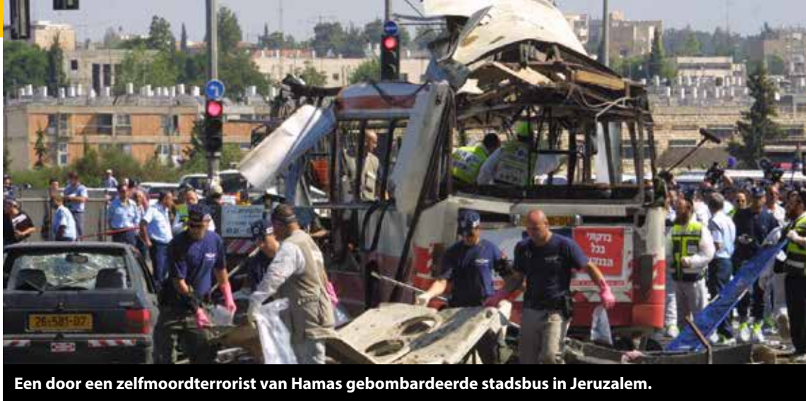
Een door een zelfmoordterrorist van Hamas gebombardeerde stadsbus in Jeruzalem.

sche Sinai woestijn. Israël reageert door militair in te grijpen, maar vernietigt Hamas niet.